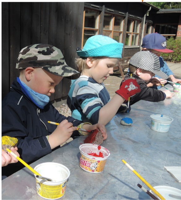
Meijän Kesä Keittiö järjestää lapsiperheille kesäistä tekemistä kesäkuussa Langinkosken kirkolla.

Kotka-Kymin seurakunnan Meijän keittiö järjestää kesäkuussa toimintaa lapsille ja perheille Langinkosken kirkolla. Suosittu kesäkiivikoiltojen Meijän keittiö viettää kesää erilaisten teemojen ja toimintojen kautta, unohtamatta perinteistä ruokailua. Kolmena keskiviikkona järjestettävä Meijän Kesä Keittiö järjestää toiminnallista ohjelmaa aamu- ja iltapäivästä lapsille. Kaikille avoin lounas on tarjolla klo 12-13. Keittolounaan hinta on tuttu 3€/hlö, alle 15-vuotiaat ilmaiseksi maksavan aikuisen seurassa. Ohjelmiin ei ole erillistä ilmoittautumista, lapset toimivat huoltajan vastuulla ohjelmissa. Tervetuloa viettämään kesäpäiviä Langinkosken kirkolle! 🌸