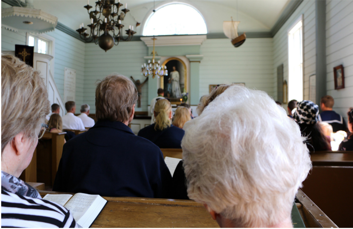
Haapasaaren kirkossa on aivan oma, ainutlaatuinen tunnelmansa.

T änäkin kesänä Haapasaaren kirkossa järjestetään kaksi messua, 16. kesäkuuta ja 21. heinäkuuta. Matka tuurimootorilla on sekä aina oma elämyksensä, olipa sitten leppoisaa auringonpaiste tai venettä keikuttava tuuli.