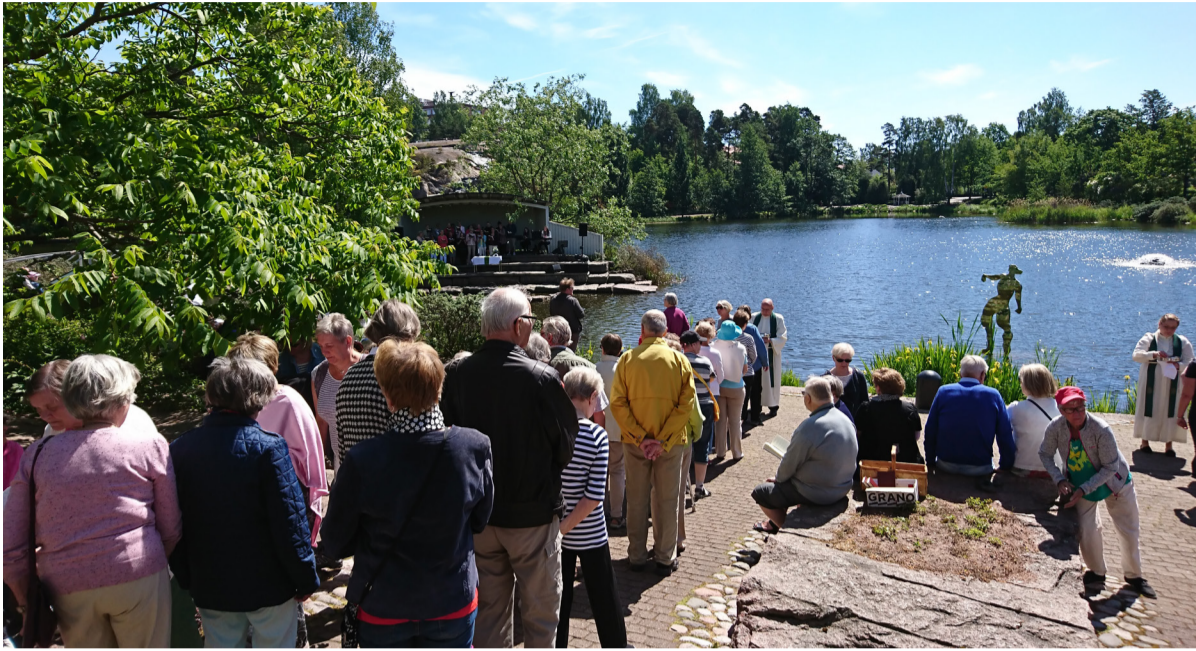
Lohisoiton messu kokoaa paljon väkeä Sapokan laululavan tuntumaan.

K ymijoen Lohisoiton ohjelmaan kuuluva messu järjestetään taas kauniissa Sapokan vesipuistossa, yhteistyössä Kotka-Kymin seurakunnan kanssa.